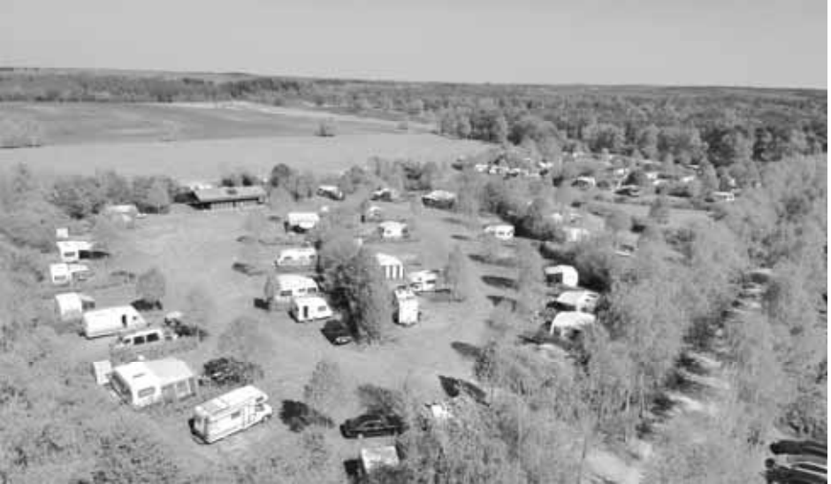
Een recente foto van Camping Lindenhof met ten noorden daarvan het voormalige landbouwterrein van 2 ha, dat voor de uitbreiding is overgedragen aan Natuurmonumenten die er natuurterrein van heeft gemaakt. Het milieuvriendelijke karakter van de camping blijkt o.a. uit het op de foto zichtbare toiletgebouw, opgebouwd uit boomstammen, met een grasdak, zonneboiler en ledverlichting.

nieuwe elektrakabels aangelegd en komt er een centraal antennesysteem. 40 huisjes en chalets zijn dan opnieuw aangesloten. Een gigantisch karwei!